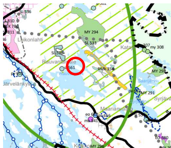
Kuva 4. Ote Pohjois-Savon maakuntakaavan 2040 2. vaiheen ehdotuksesta. Suunnittelualueen sijainti on osoitettu punaisella ympyrällä.

Pohjois-Savon maakuntakaava 2040 2.vaiheen laatiminen on käynnissä. Kaavaehdotus on ollut nähtävillä 16.1.–23.2.2024 välisen ajan. Suunnittelualue sijoittuu kokonaisuudessaan alueelle ”Laajat metsäpeitteiset alueet”. Merkinnän määräyksen mukaisesti ”Merkinnällä osoitetaan maakunnallisesti merkittävät laajat metsäpeitteiset alueet, jotka ovat ja säilyvät ensisijaisesti metsätalouskäytössä.”