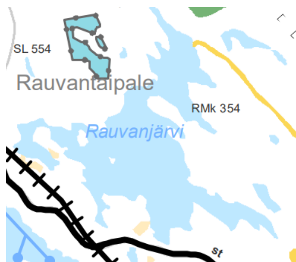
Kuva 3. Ote Pohjois-Savon maakuntakaavayhdistelmästä.

Suunnittelualue sijoittuu maakuntakaavassa laajalle virkistys- ja matkailuvyöhykkeelle.