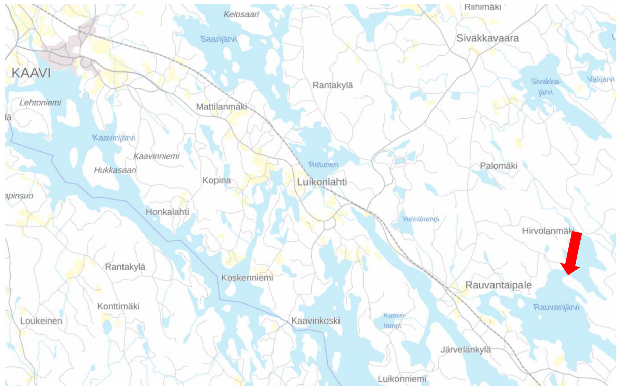
Kuva 1. Suunnittelualueen sijainti on esitetty punaisella nuolella.

Kaavin kuntaan Rauvanjärven rannalle tilalle Hiekkaniemi 204-409-11-19 on tarkoitus laatia ranta-asemakaava. Kaava-alue sijaitsee noin 20 km Kaavin keskustasta kaakkoon. Suunnittelualueen pinta-ala on noin 3,8 ha. Suunnittelualueen sijainti ja likimääräinen raja-alue ilmenevät seuraavista kuvista.