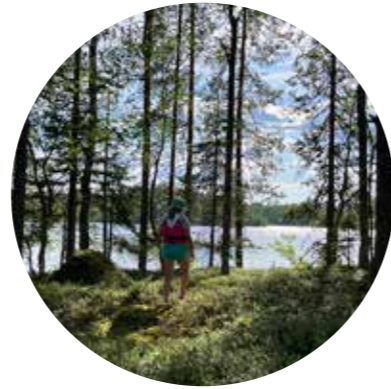
Kalmosaari | Vaikkojärvi, Juuka (Kartassa sivulla 10)

Uskoivatko Kalmosaareen haudatut ihmiset, että Linnunrata johtaisi vainajien sielut tuonpuoleiseen? Saareissa voi havainnoida tähtitaivaan yhteyksiä hautapaikan maisemaan.