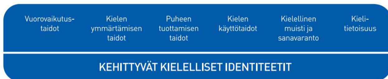
Kuvio 2. Lasten kielen kehityksen keskeiset osa-alueet varhaiskasvatuksessa

Kielen oppimisen kannalta on tärkeää tiedostaa, että saman ikäiset lapset voivat olla eri vaiheissa kielen kehityksen eri osa-alueilla. Kielelliset identiteetit kehittyvät , kun lapsia ohjataan ja tuetaan kielellisten taitojen ja valmiuksien keskeisillä osa-alueilla.